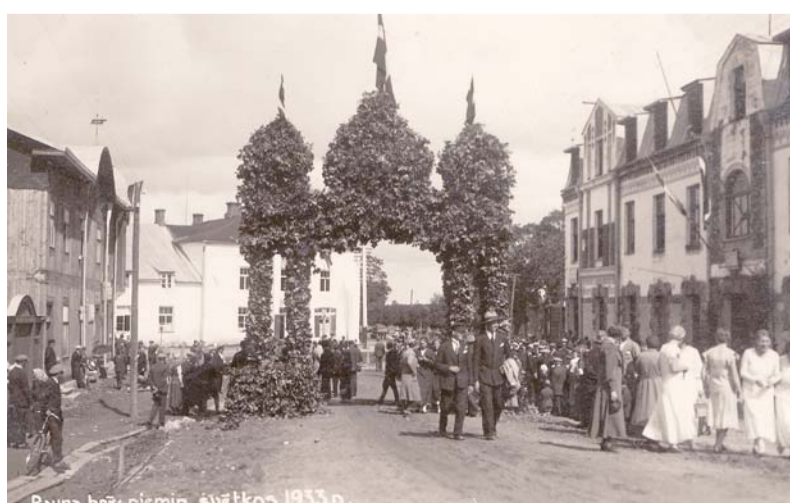
Rauna bez piem. svētkos 1933.p.