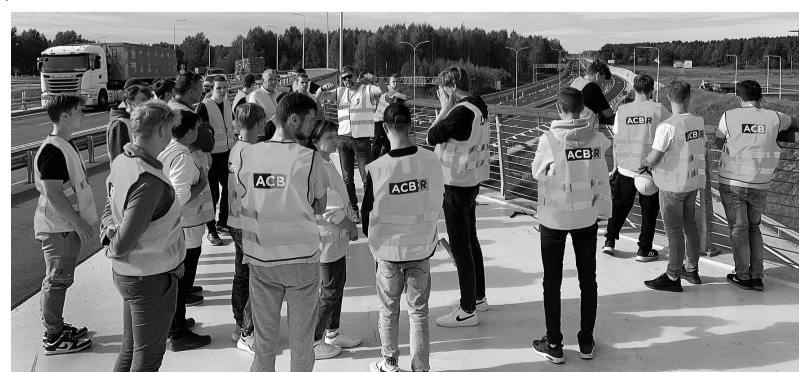
Tehnikuma būvniecības mācību audzēkņiem un skolotājiem ekskluzīva iespēja – viesoties vērienīgos Latvijas būvobjektos isi pirms to atklāšanas.

Jauna pieredze un iespējas darba vidē – tā īsumā varētu teikt par 4. kursa automehāniku kursa