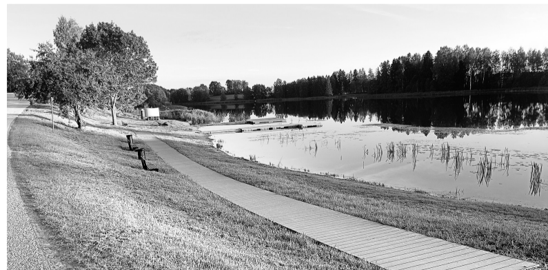
Rudens noskaņas Krogus ezera promenādē