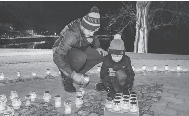
Gaismas akcijā iesaistījās vietējie uzņēmēji un organizācijas, gan lieli, gan mazi – paldies ikvienam par svētku sajūtu!

Smiltene novada pašvaldības darbinieki jau trešo reizi sveču gaismā ietērpa Smiltene pilsētas ģerboni Vecā parka estrādē. To aicināja darīt arī ikvienu citu pasākuma apmeklētāju.