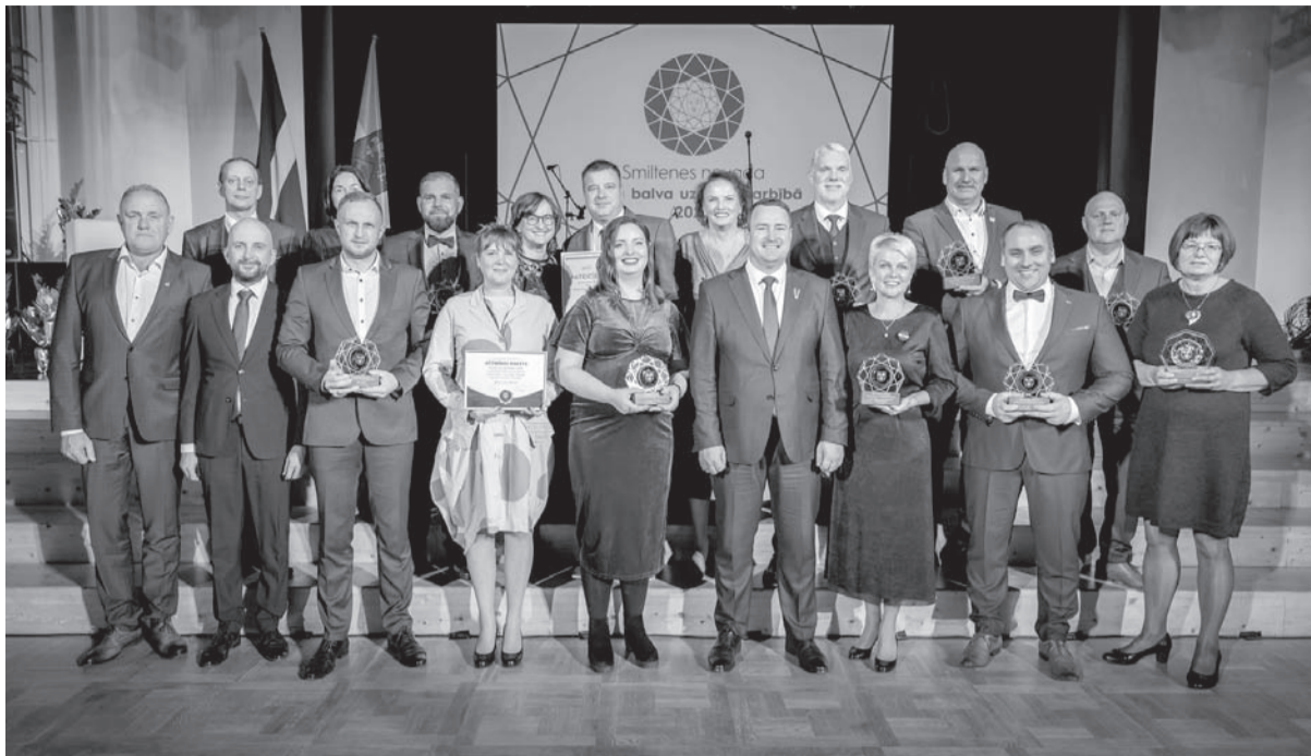
Smiltenes novada pašvaldības konkursa „Gada balva uzņēmējdarbībā” 2023. gada laureāti.

Uzņēmums AS „Stora Enso Latvija”. Iedzīvotāju ienākuma