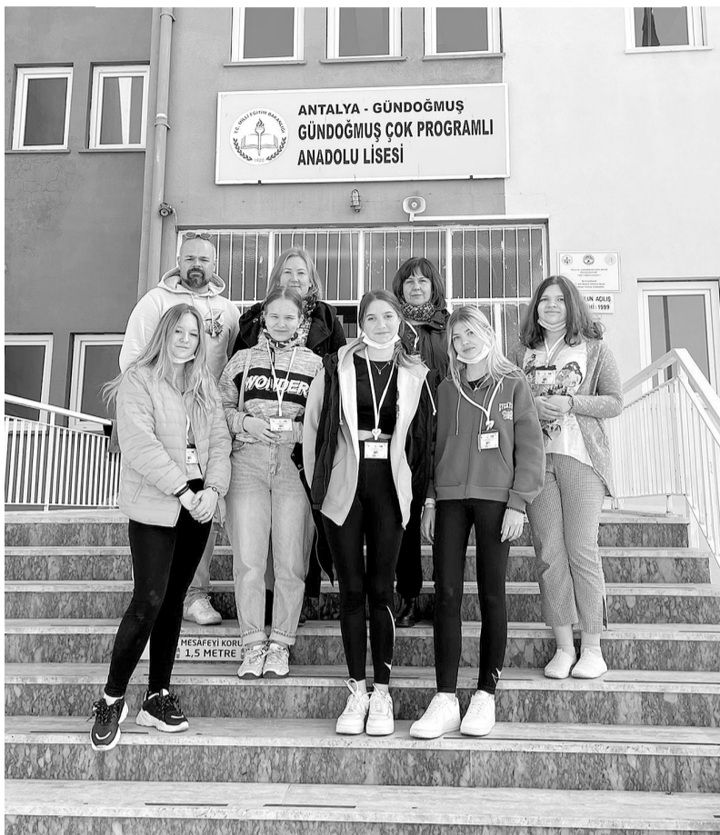
DOApes pamatskolas projekta dalībnieki pie Gundogmus Anadolu liceja.

Bet vakarā, pateicoties tam, ka drošības nolūkos projekta dalībniekus vairs neizmitina ģimenēs, bet visi dzīvo viesnīcās, jauniešiem bija iespēja tuvāk iepazīt vienu otru, mācīties dejas, dziedāt populāras dziesmas, muzicēt un vienkārši runāt. Pedagogiem bija