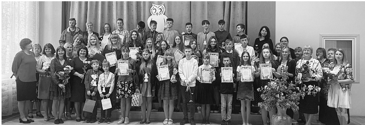
Zinību svētki O. Vācieša Gaujienas pamatskolā