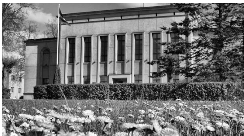
Smiltenes vidusskolas vēsturē šis gads ieies ar lielajiem būvniecības darbiem, skolas akreditāciju un jauniešu izcilajiem sasniegumiem mācību darbā.