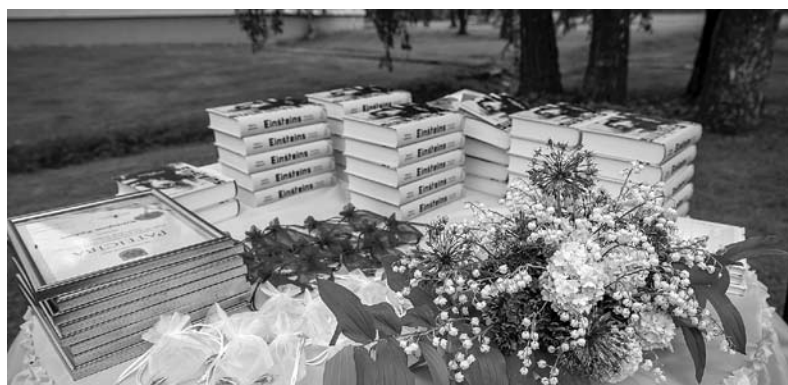
Smiltenes vidusskolas 12. klašu skolēni 2021. gada 5. jūniju vienmēr atcerēsies kā sava izlaiduma dienu.