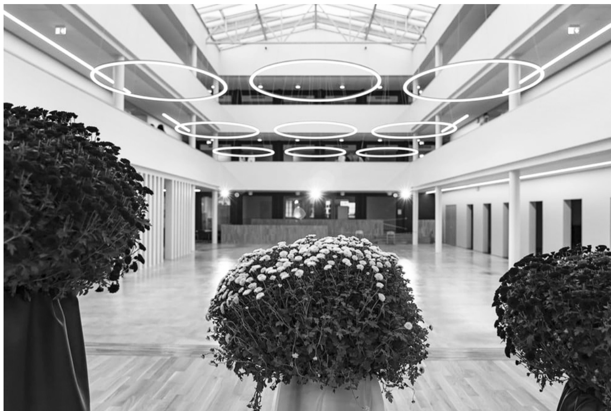
Svinīgi skaista un saposta Latvijas Valsts svētkiem tikko renovētā Smiltenes vidusskola sagaidīja skolēnus un darbiniekus.

Projekta mērķis: veidot skolēnu izpratni par to, ka valodas zināšanas un prasmes paver durvis plašu iespēju pasaulei, tajā pašā laikā apzinoties, ka valodas prasmes trūkums mūs šķir, jo tiek zaudēta kopības izjūta, kā arī bez kopīgas valodas mēs nevaram izplatīt savu unikālo kultūru pasaulē. Projektā skolēni tiek rosināti lepoties ar savu nacionālo kultūru, vienlaikus arī spējot skatīt sevi vienotā kopienā