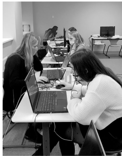
3. decembrī Smiltenes vidusskolā pēc gada pārtraukumu „Erasmus+” stratēģisko skolu sadarbības partnerību projekta „Valoda vieno vai šķir” aktivitātes.

Smiltenes vidusskola ir viena no Latvijas skolām, kuras skolotāji, skolēni un vecāki šogad aktīvi iesaistījušies Mūžizglītības un kul-