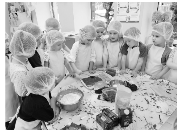
„Mārtiņes” grupa gatavo svētku kārumus.

A. Rozniece, Pirmsskolas skolotāja A. Rozniece foto