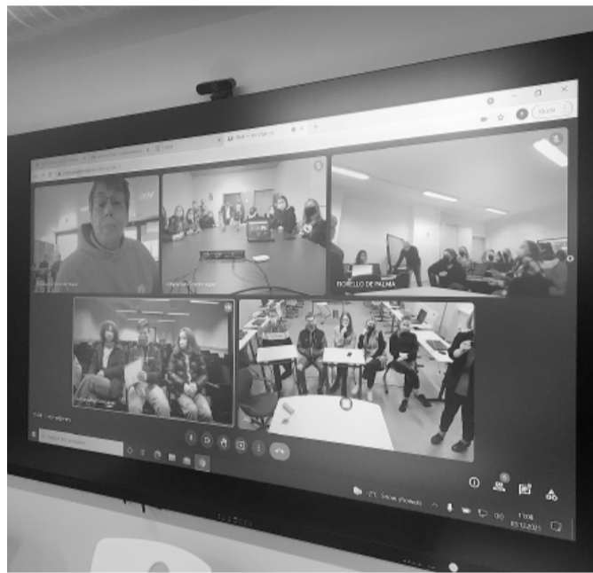
26. novembrī 21 Smiltenes vidusskolas 10. – 12. klašu skolēns tiešsaistē piedalījās starptautiskajā konkursā „The Best in English 2021”.

Eiropā, kurā valoda ir saistīta ar nākotnes perspektīvām, aktīvu līdzdalību globālajā pasaulē, sava potenciāla sasniegšanu. Tiek skatīta arī valoda kā viens no cilvēka uzvedības kultūras pamatelementiem. Projekts sniedz izpratni par kultūru nevienādīgumu un daudzveidību, tādējādi veicinot toleranci, citādā