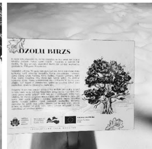
Projekta „Kopā mēs varam!” realizācija novembra mēnesī klātienē norisinājās, ievērojot valstī noteiktos ierobežojumus!