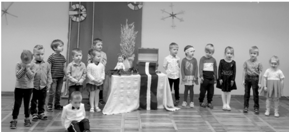
„Bitiņes” grupas svētku koncerts.

Kopīgi pārrunājot ar bērniem, kā mēs varētu nosvinēt Latvijas dzimšanas dienu, ierosinājumi bija akurāt tādi, kādas dzimšanas dienas svinības esam pieraduši svinēt paši. Dzimšanas dienai piestāv apēst ko gardu, dziedāt un dejot. Tad nu šie ieteikumi tika ņemti vērā. „Mārtiņes” un „Bitiņes” grupas bērni iejutās pavāru lomā un gatavoja svētku kārumus, izvēloties balto biezpienu, zemenes un dzērvenes. „Saulītes” grupa gatavoja svētku luksturīšus un vakarpusē tos iedēda pie iestādes ieejas. Mazie „Eži” veidoja telpas rotājumus patriotiskās noskaņās.