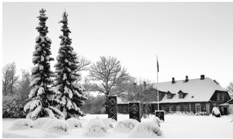
Skaistos latvju rakstus Kalnamuižā izgreznojušas sniega un ledus pērlītes.