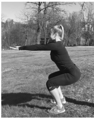
Nedēļas sākumā tehnikuma audzēkņi saņēma uzdevumu – sagatavot konspektus un videomateriālu par to, kā viņi izpilda sešus vingrinājumus dažādām muskuļu grupām.