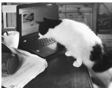
Mincis pārbauda, vai nākamais veterinārārsta asistents par viņu visu uzrakstījis pareizi.