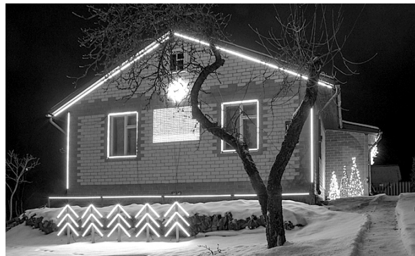
Pilskalna iela 10A, Smiltene.