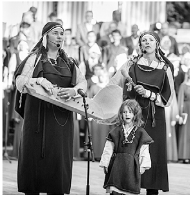
Lielkoncerts „Es esmu Latvija”.

22. Pilsētas svētki „Manas pēdas Smiltenes zemē” pirmo reizi pulcē novadniekus Tepera ezera promenādē ar dažādām aizraujošām, muzikālām, mākslas un sporta