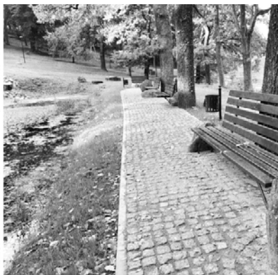
Smiltenes parka atjaunošana.