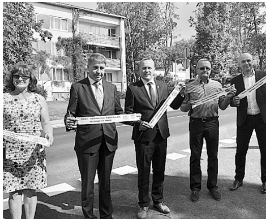
Gaujas ielas pārbūves noslēgums.