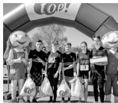
„top! ielu stafetes”.

30. „Ieriteņo simtgadē” – Smiltenes novada Tūrisma un informācijas centra 20 gadu jubileja tiek