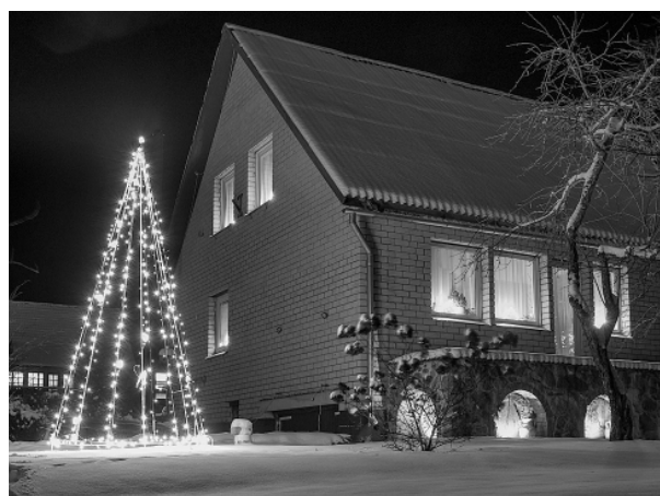
Līvānu iela 7, Variņi.

Akcijas dalībnieku veikums bija ļoti atšķirīgs, oriģināls un ar savu stāstu. Daudzviet redzējām, ka īpašumi, salīdzinājumā ar iepriekšējiem gadiem, ievērojami ir papildināti ar jauniem, pārdomātiem rotājumiem, kā arī ar tādiem, kas priecē apkārtējos arī dienas gaišajā laikā. Paldies ikvienam akcijas dalībniekam, kas, ar savu gaumīgi izrotāto īpašumu, radīja svētku sajūtu iedzīvotājiem Smiltenes novadā!”