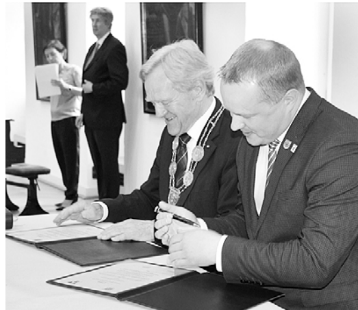
Villihās un Smiltēnovada pašvaldību partnerlīguma parakstīšana.

74. Daudzdzīvokļu mājas Daugavas ielā 7a , Smiltēnovadā pārbūvēti 24 jauni dzīvokļi novadā strādājošu uzņēmumu speciālistiem.