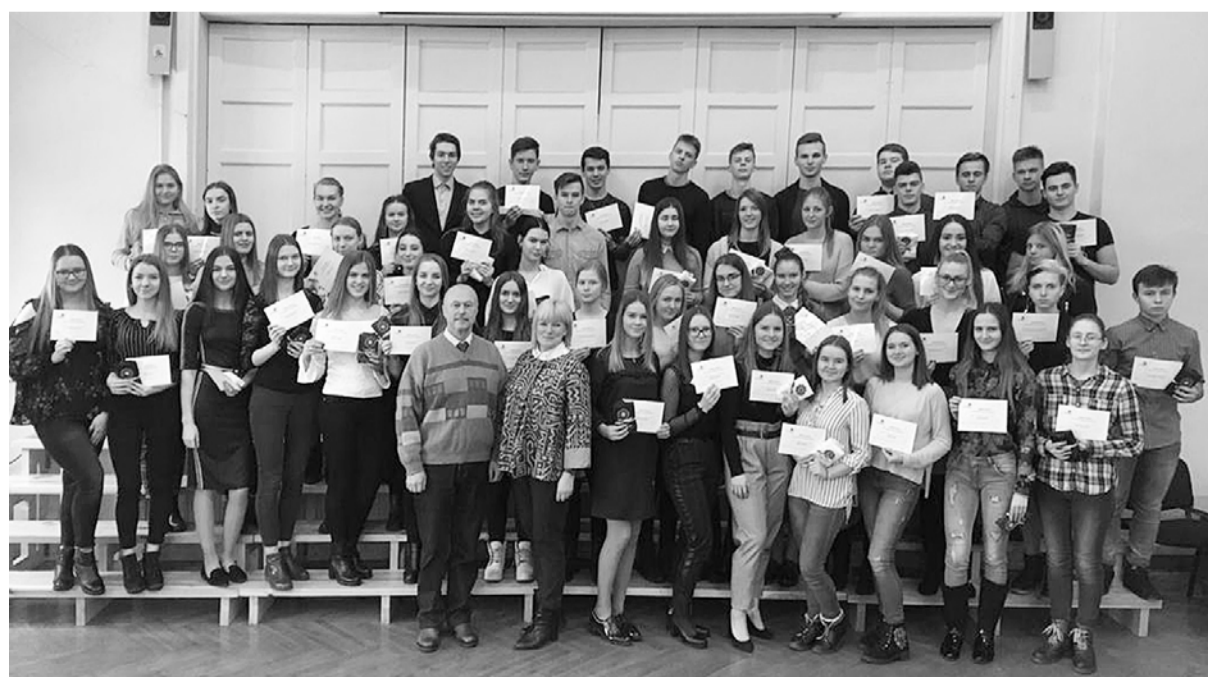
Smiltenes novada domes stipendiāti.

Neliekuļojot varu teikt, ka man ir laime mācīties ļoti draudzīgā klasē, sirsnīgā skolas kolektīvā. Arī