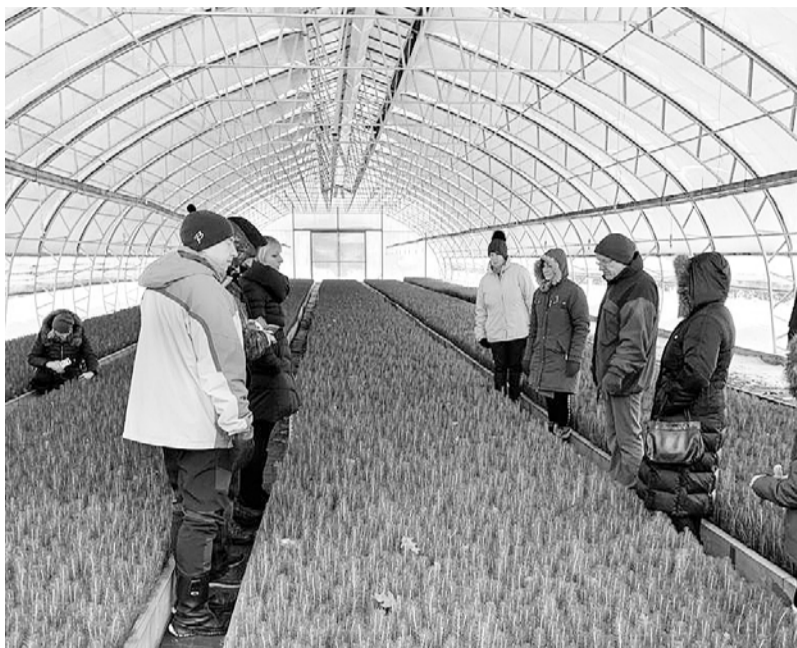
Dalībnieki viesojas AS „Latvijas Valsts meži” Smiltē kokaudzētavā.