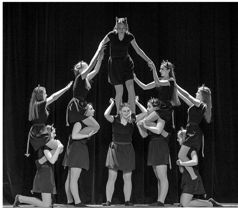
Aerobikas festivāls, 12.b klases meiteņu priekšnesums.

Vēlaties, lai jūsu bērns mācās vienā no lielākajām un tradīcijām bagātākajām Vidzemes skolām? Jums ir svarīgi, lai viņš iegūst kvalitatīvu, mūsdienīgu izglītību, iesaistās dažādos Latvijas un starptautiska mēroga projektos, un izaug par radošu un daudzpusīgu personību! Nāciet uz Smiltenes vidusskolu!