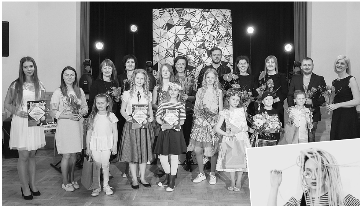
2018. gada konkursa laureāti.

Konkursa „Smiltenes balstiņas” mērķis ir veicināt bērnu un jauniešu muzikālo spēju attīstību, pilnveidot uzstāšanās iemaņas un skatuves kultūru, sekmēt latviešu komponistu dziesmu un latviešu tautasdziesmu apguvi. Tam var pieteikties Smiltenes novadā dzīvojoši bērni un jaunieši vecumā no 7 līdz 15 gadiem. Konkursa dalībnieka (solista, dueta vai trio) uzdevums ir sagatavot vienu priekšnesumu – dziesmu latviešu valodā atbilstoši savam vecumam un vokālajām spējām. Dalībniekus, kā allaž, vērtēs Smiltenes pilsētas Kultūras centra apstiprināta, profesionāla žūrija un īpašais viesis – kāds populārs, iemīļots mūziķis, kura vārds šobrīd netiek atklāts un paliek kā pārstei-