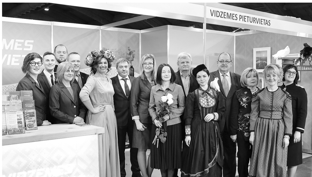
Vidzemes pieturas stenda atklāšana koā ar Smiltenes, Apes, Raunas, Alūksnes novadu pašvaldību vadītājiem.

Smiltenes novada Tūrisma informācijas centrs (TIC) piedalījies starptautiskajā tūrisma izstādē – gadatirgū „Balttour 2019”, kur kopā ar kaimiņu pašvaldībām standā „Vidzemes pieturvietās” prezentēja aktīvās atpūtas piedāvājumus un iespējas Smiltenes novadā.