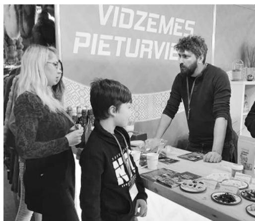
„Birzi” sulu degustācijas.

varēja sastapt Firsta madāmu Lilī ar saviem palīgiem no Smiltenes mui-