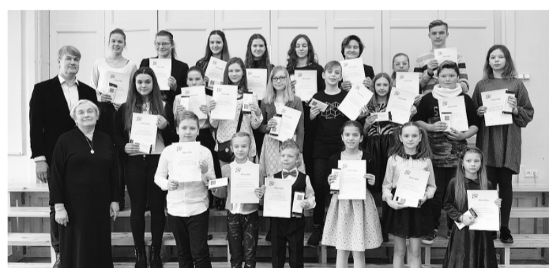
Skatuves runas konkursa dalībnieki

Katru gadu februārī Smiltenes novadā notiek skatuves runas