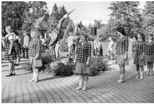
Svētki Palsmanes pagastā.

Aicinām būt kopā arī turpmāk gan svētkos, gan ikdienā un ar lepnumu raudzīties uz katra paveikto un sasniegto savas mājas, uzņēmuma attīstībā, kas ir kā pamats novada izaugsmē arī turpmāk!