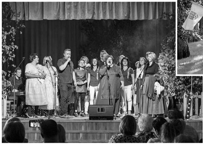
Svētki Grundzāles pagastā.