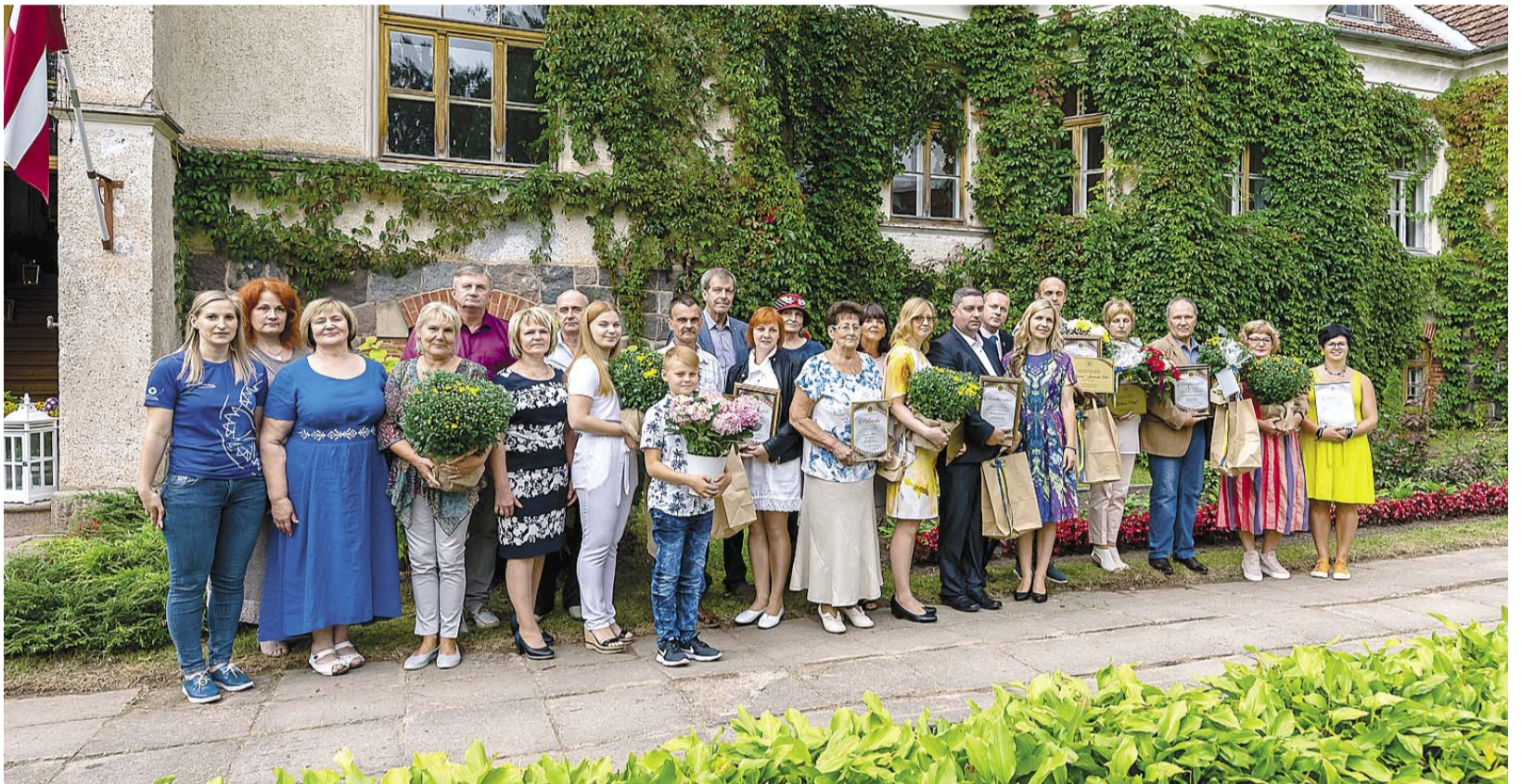
Konkursa „Smiltenes novada sakoptākais īpašums 2019” laureāti, dalībnieki, vērtēšanas komisijas locekļi.