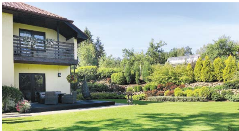
Blaumaņa iela 34, Smiltene.