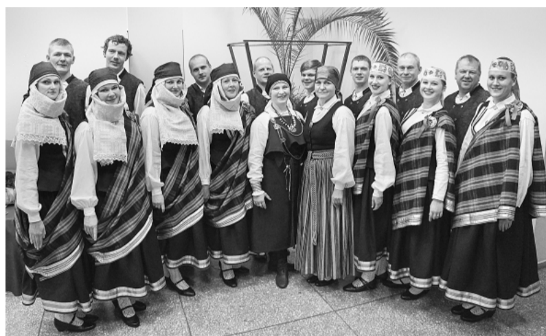
Deju kolektīvs Rieda.