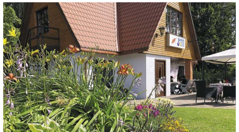
Kafejnīca „Jautrais Ods”.

gaumīga lapene atpūtas brīžiem. Šis pagalmis, iebraucot Palsmanē, veido sakopta centra sajūtu un ar savu krāšņumu vienmēr iepriecina arī garāmgājējus.