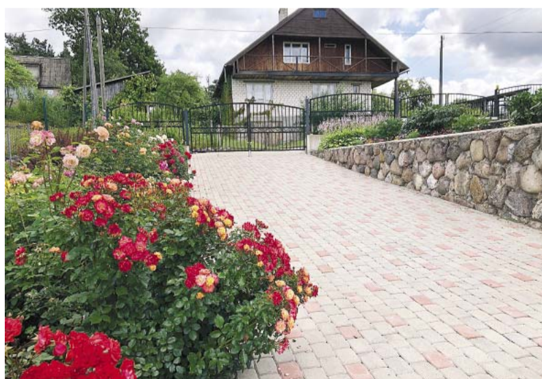
Jaunā iela 2b, Smiltene.