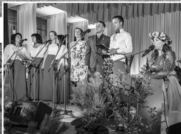
Svētki Launkalnes pagastā.