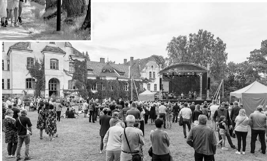
Svētku noslēgums Bilskas pagastā.