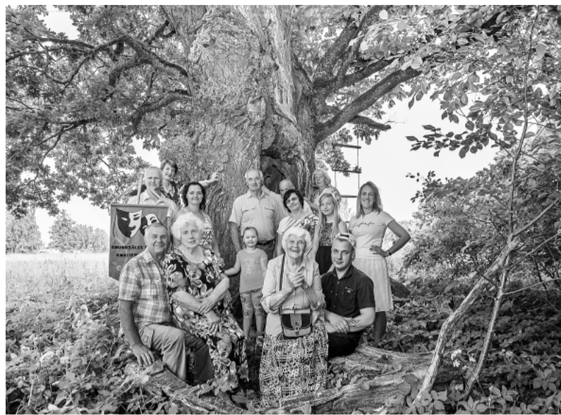
Grundzāles amatierteātris „Cik jaudas” pie Grundzāles pagasta Paleju dižozola.