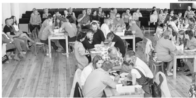
Svētki Variņu pagastā.