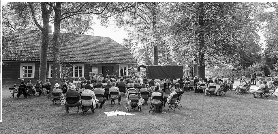
Svētki Blomes pagastā.