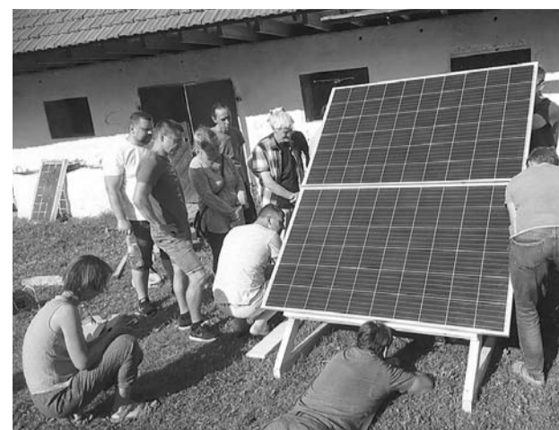
Projekta dalībnieki izgatavo un apmāca uzstādīt saules paneļus.