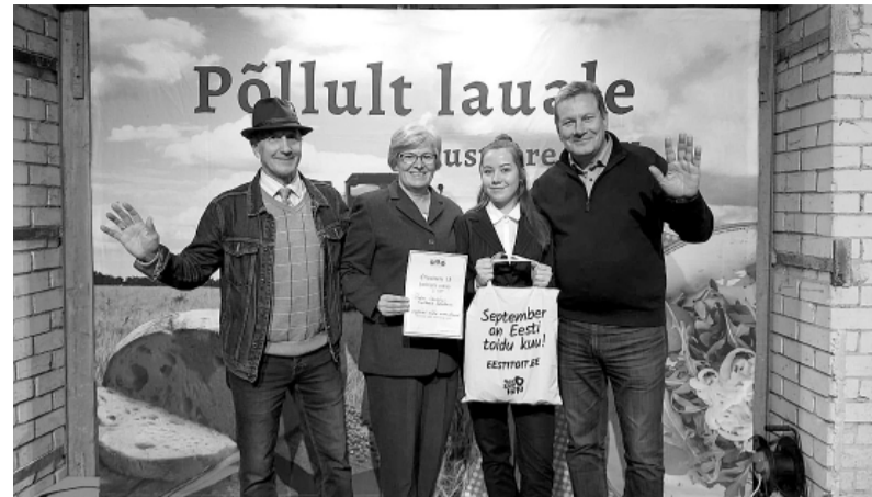
Skolotāji apgūst Igaunijas pieredzi.

Vērtēts tika arī katras komandas vizuālais noformējums. „Protams, novērtējums ir svarīgs, taču daudz būtiskāka ir tā īpašā sajūta, kas pārņem brīdī, kad nostājamies cits citam