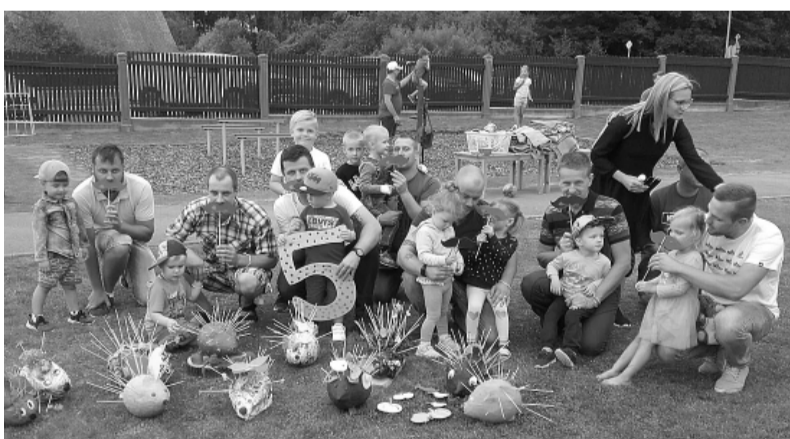
Tēvu dienas pasākums.