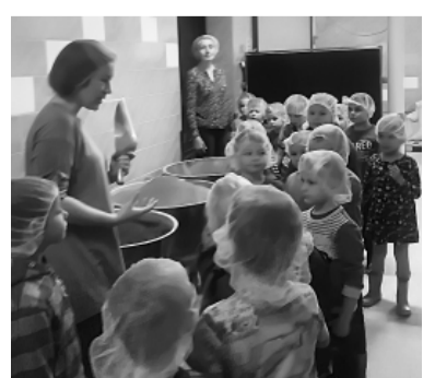
Viesos „Ķelmēni” ceptuvē.

Palsmanes pagasta pirmsskolas iestāde katru gadu oktobra mēnesī īsteno projektu „Iepazīsti senos amatus”! Šogad izvēlējamies maizes cepēja arodu, kurš ir viens no senākajiem arodiem pasaulē un kurā no paaudzes paaudzē tiek nodotas maizītes cepēju gudrības. Iestādes lielākie pirmsskolnieki devās mācību ekskursijā uz „Ķelmēnu” maizes ceptuvi, lai iepazītos, kā top gardā maize, no kuras Tēvu dienas pa-