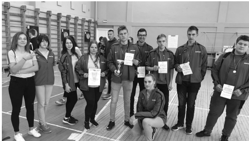
30. finālsacensības šautriņu mešanā mērķī.

Turpat 40 dažādu recepšu, Smiltenes tehnikumā vārītie ievārījumi, marmelādes, džemi, sīrupi un sāļās mērces prezentēja skolas nākamo ēdināšanas pakalpojumu speciālistu un viņu skolotāju kopīgo veikumu Starptautiskajā marmelāžu gadatirgū