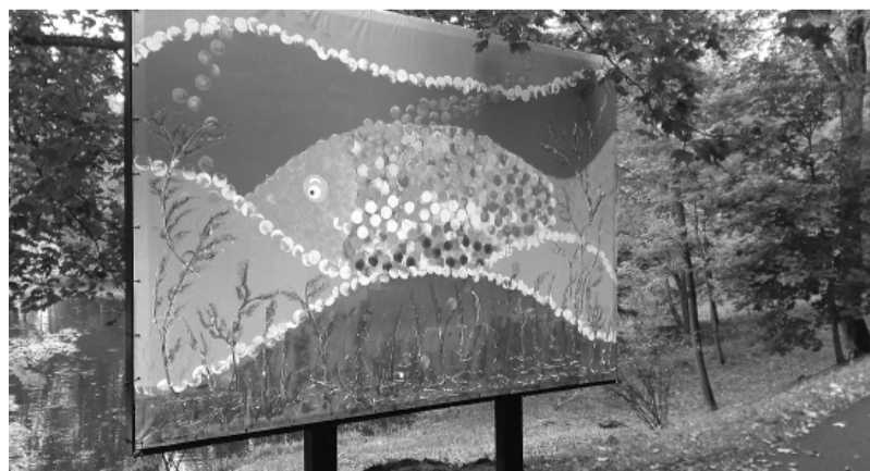
Vecajā parkā uzstādītas lielformāta gleznas.

Gleznām nezaudēt savu burvību arī tumšajos gadalaikos, rudens lietavās un ziemas puteņos palīdzēs īpaši šim nolūkam izraudzītās krās-