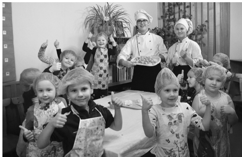
Smiltenes novadā būs daudz jauno pavāru.