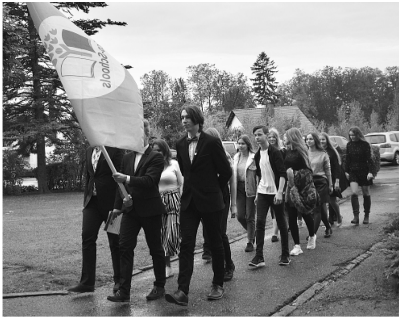
Zaļā karoga pacelšana.

Šogad pie visām trim Smiltenes vidusskolas ēkām plīvo Starptautiskais Zaļais Karogs! Tas godam nopelnīts, visu klašu skolēniem piedaloties dažādās Eko skolu programmas aktivitātēs. Svinīgie karoga pacelšanas brīži pie katras no skolas ēkām atsauc atmiņā to, kā Eko