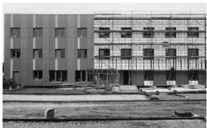
Smiltenes vidusskolas dienesta viesnīca.