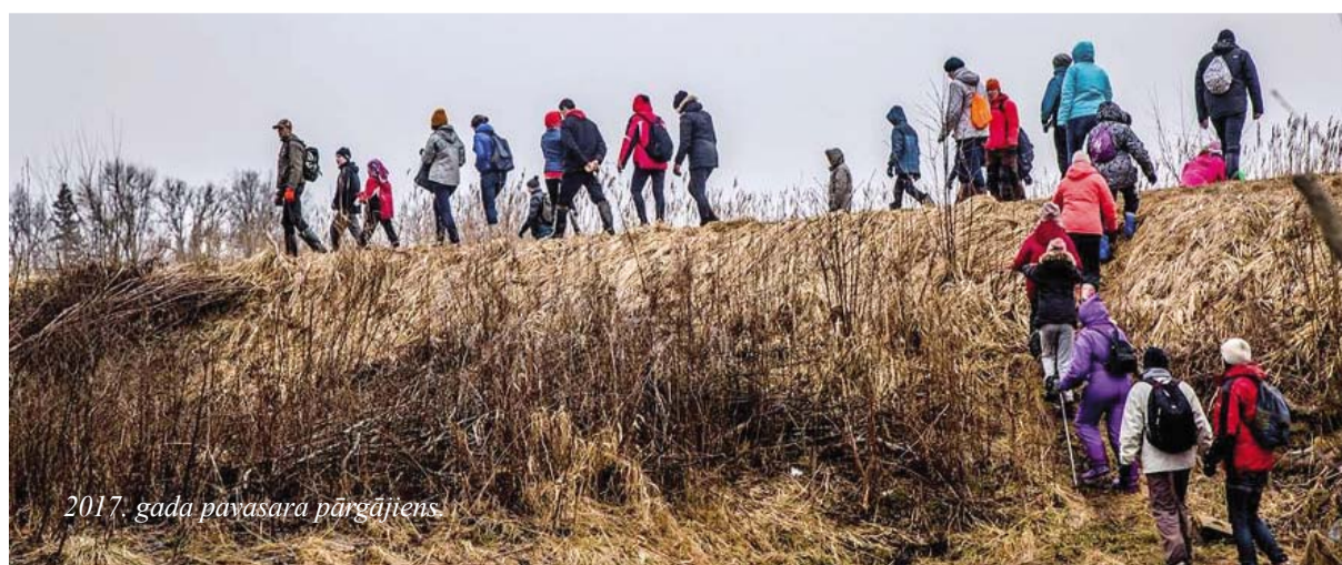
2017. gada pavasara pārgājiens

Pavasara pārgājiens notiek Smiltenes novada domes projekta „Pasākumi vietējās sabiedrības veselības veicināšanai Smiltenes novadā” ietvaros.