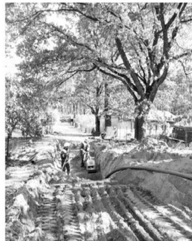
Būvdarbi Smiltenes pilsētas ielās (Raiņa iela, Priežu iela).