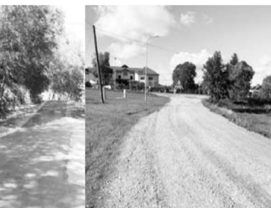
Pabeigti būvdarbi Smiltenes pilsētas ielās (Mazajā Līgo ielā/ Kalnamuižā un Lazdu ielā).

Veiksmīgi, saskaņā ar apstiprināto laika grafiku, norisinās apakšzemes komunikāciju izbūve Kohēzijas fonda līdzfinansētajā projektā „Ūdenssaimniecības un kanalizācijas tīklu paplašināšana Smiltēnē 3. kārtā”.