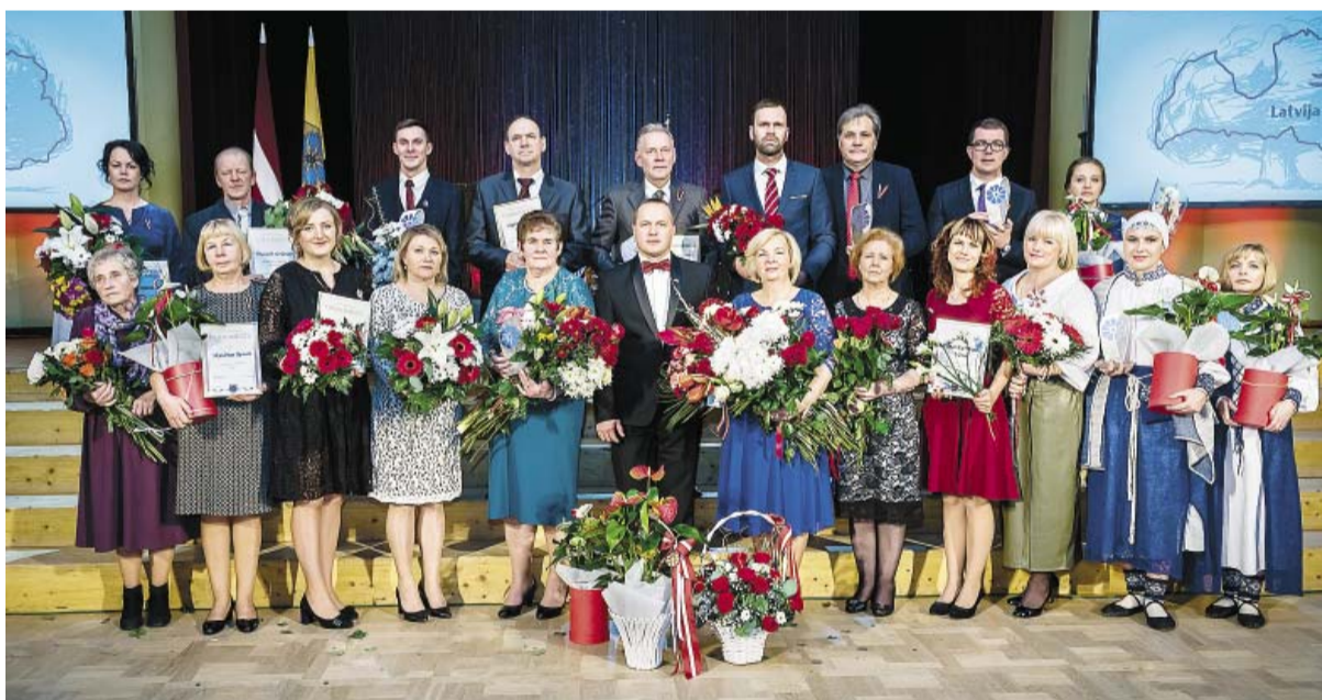
2018. gada Smiltenes novada domes apbalvojumu laureāti.

Šogad Smiltenes novada domes augstāko pašvaldības apbalvo-