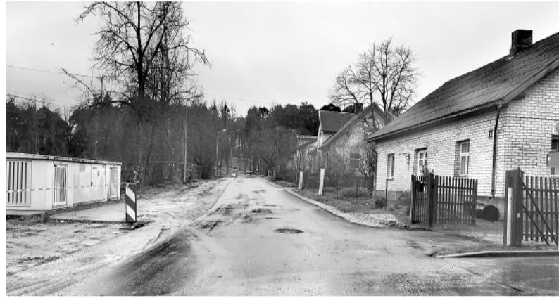
Kalēju iela, Smiltene

rodoties personīgi SIA „Smiltenes NKUP”, Pils ielā 3a, Smiltēnē vai aizpildot elektroniski iesniegumu www.smiltenesnkup.lv .