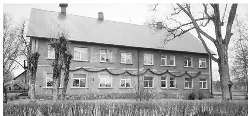
Palsmanes pamatskola šodien.

cē gan pašus, gan ikvienu pagasta iedzīvotāju un ciemiņu.