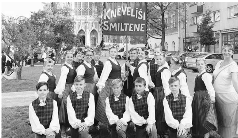
Kolektīva „Knēvelīši” dejotāji jaunajos tērpos.

Atbalsta Zemkopības ministrija un Lauku atbalsta dienests