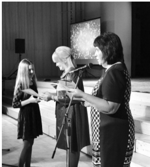
Liecību pasniegšana Ziemassvētkos