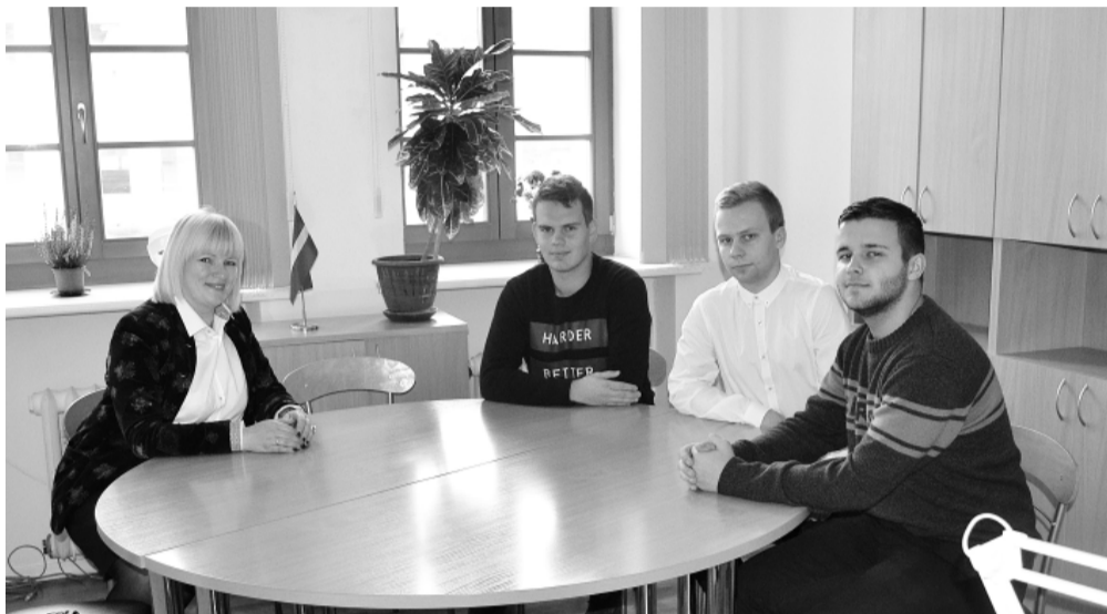
Kopā ar pašpārvaldes prezidentu