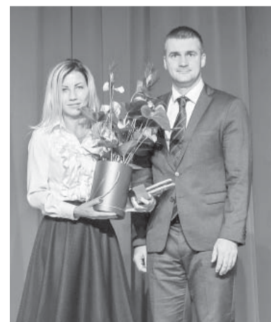
Balvu SIA „Dzērves nami” pasniedza Latvijas Valsts ceļi” valdes priekšsēdētājs Jānis Lange.

Nominācijā „Uzņēmējdarbības būve” balvu saņēma SIA „Dzērves nami” – 2013. gada Smiltenes novada dome nolēma nodot nomā ar apbūves tiesībām SIA „Dzērves nami” zemes gabalu Smiltē, Kaikas ielā 1, ar kopējo platību 9802 m 2 , tādējādi atbalstot uzņēmējdarbības attīstītu