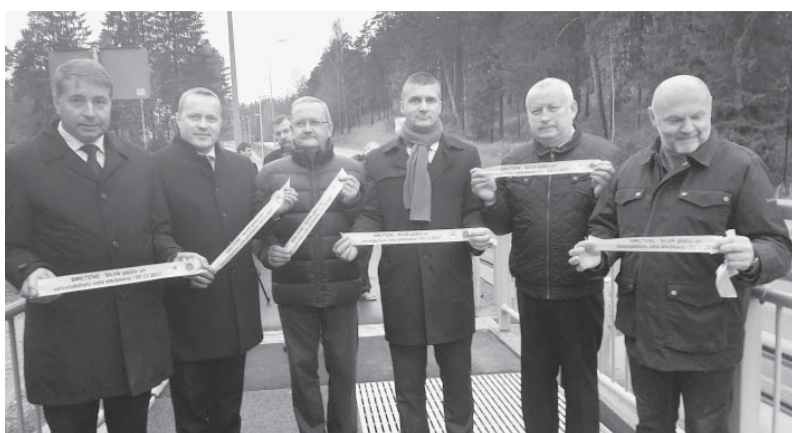
Svinīgā tilta pār Abuls upi atklāšana.

Sakārtoti tilti un ceļi ir būtisks priekšnosacījums jebkuras tautsaimniecības nozares attīstībai, tāpēc īpaši vēlamies atzīmēt projektā veiktā tilta pār Abuls upi pārbūvi. Tā īstenošana kļuva iespējama, pateicoties saņemtajam valsts budžeta līdzfinansējumam no valsts autoceļu fonda programmas. Šis ir