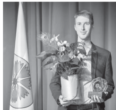
Smiltenes novada jaunais uzņēmējs SIA „RIK mežs”.

Nominācijā „Smiltenes novada jaunais uzņēmējs” balvu saņēma SIA „RIK mežs” – jauns un veiksmīgs Smiltenes novada uzņēmums,