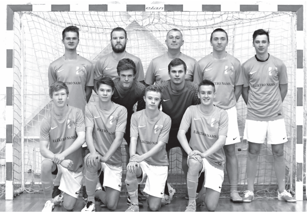
Komandas "Elektronams".

Šogad Smiltenes telpu futbola čempionāts ir mainījis nosaukumu uz Vidzemes telpu futbola čempionātu, lai spētu piesaistīt vairāk komandas no blakus novadiem un attīstītu telpu futbolu Vidzemes reģionā.