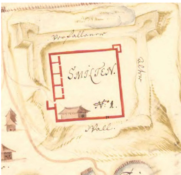
1. att. Smiltenes pils un muižas plāns. 17. gs. sok.riksarkivet.se/bildvisning/K0012750_00001