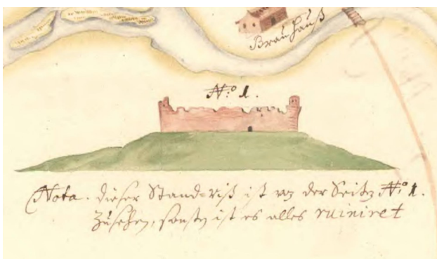
2. att. Smiltenes pils fasādes zīmējums. 17. gs. sok.riksarkivet.se/bildvisning/K0012750_00001

17. gs. plānā redzams, ka pils pagalma dienvidrietumu malā bijusi pie apkārtsienas bloķēta mūra ēka (turpmāk – DR korpus) ar četrām telpām (4. att.: D). Savietojot 17. gs. un mūsdienu situācijas plānu, redzams, ka vārtiem tuvākās korpusa daļas kontūras atbilst 19. gs. celtās, līdz mūsdienām saglabātās saimniecības ēkas (smēdes) apjomam. Visticamāk, DR korpusa dienvidu daļas mūri iekļauti esošās ēkas konstrukcijās.