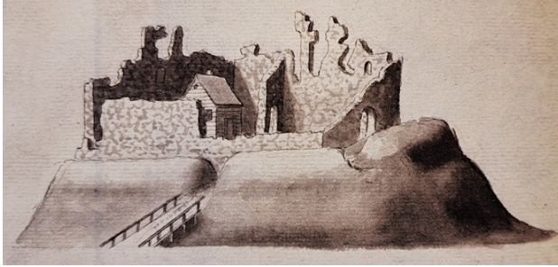
3. att. Smiltenes pils no ziemeļiem. 1788. g. Johans Kristofs Broce, BM03233AM acadlib.lu.lv/broce/ielbildes/sejums_nr3/bm03233am.htm