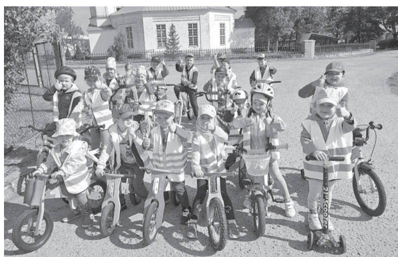
Mazie palsmanieši skaita noriteņotos kilometrus konkursā „Eiropas jūdze 2023”.

Sagaidot Līgo dienu, tapa vasaras gleznas no sanestajām jāņzālēm un dekori – lieli un mazi vainadzīņi, ko gan likt galvā, gan izrotāt iestādes teritoriju. Lielākais prieks un gandarījums bērniem bija par šīs prasmes apgušanu, jo teicās