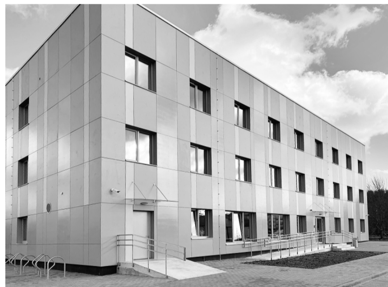
Jaunā internāta ēka pie Smiltenes vidusskolas.

Projekta mērķis ir uzlabot mācību vidi Smiltenes vidusskolā, veicot ieguldījumus un attīstīt esošo infrastruktūru, lai sekmētu plānoto kompetenču pieejā balstītā vispārējās izglītības satura pakāpenisku ieviešanu.