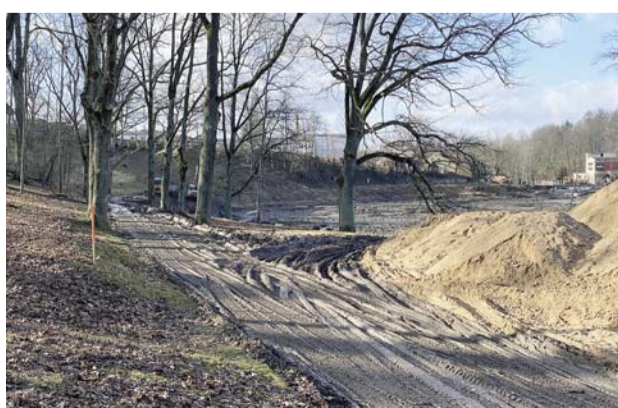
Būvdarbu norise Vecajā parkā.

Noslēguma kārtā paredzēts veikt atlikušo ceļiņu pārbūvi, tai skaitā sadzīves kanalizācijas pārbūvi posmā no Centrālā laukuma līdz Abulas ielai, izveidot jaunu šķembu seguma taku, piknika vietu, laivu