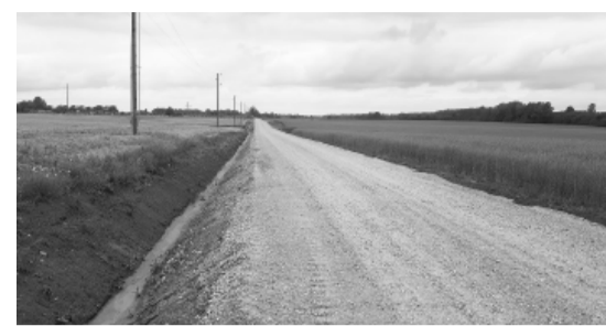
Autoceļš Smiltene – Stariņi.

Projektēšanas darbus veica SIA „Vertex projekti”, būvuzraudzību nodrošināja SIA „IPAC”, bet būvdarbu izpildi veica SIA „8 CBR”,