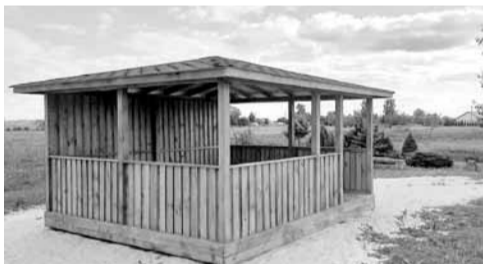
Kopējās izmaksas – 4 114 eiro Realizācijas vieta – Bilskas pagasts

Projekta laikā paredzēts uzstādīt lapeni Mēru aktīvās atpūtas laukumā, lai iedzīvotājiem būtu vieta, kur patverties no lietus, vēja vai saules. Lapeni plānots izmantot arī nelieliem āra pasākumiem. Ņemot vērā, ka laukuma noslogojums ir pietiekams, Mēru ciema iedzīvotāji bieži izmanto šo vietu, lai aktīvi un sportiski pavadītu savu brīvo laiku, kā arī uz laukuma tiek rīkoti dažādi āra pasākumi, līdz ar to lapenes izveide ir svarīga priekš Mēru ciema iedzīvotājiem.