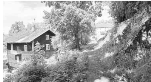
Kopējās izmaksas – 1 900 eiro Realizācijas vieta – Gaujienas pagasts

Projekta mērķis ir izveidot drošu segumu iedzīvotāju iemīļotajā taciņā gar dārza mūri pie „Anniņu” muzeja. Šī taka ir daudziem iedzīvotājiem un Gaujienas viesiem taisnākais ikdienas ceļš uz skolu vai darbu, kā arī populāra pastaigu vieta. Gaujienas muižas parks ir iecienīta pastaigu vieta gan vietējiem iedzīvotājiem, gan viesiem. Parasti ikdienas ceļš uz skolu vai veikalu ved pa celiņu gar bijušā muižas augļu dārza mūri, no kuras paveras gleznains skats uz „Anniņu” ieleju. Šī taka ir būtiska arī daudzo vasaras nometņu laikā, jo savieno nakšņošanas un ēdināšanas vietas. Tā kļūst īpaši nozīmīga pasākumu un koncertu laikā „Anniņās”, kad pulcējas daudz cilvēku. Projekts nodrošinās, ka taka ir droša un pieejama visiem, uzlabojot piekļuvi svarīgām vietām.