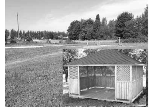
Kopējās izmaksas – 9407,75 eiro Realizācijas vieta – Trapenes pagasts

nots uzstādīt lapeni, kurā būs galds ar soliēm, kā arī novietot atpūtas soliņus blakus katram volejbola laukumam. Šobrīd šajā teritorijā nav pieejama pajumte pēkšņu lietusgāžu gadījumos vai vieta, kur patverties no saules. Jaunā lapene un soliņi nodrošinās arī apmeklētājiem ērtu vietu, kur atpūsties un veikt organizatoriskos darbus. Tā būs ideāla vieta, lai pulcētos pirms un pēc sportiskajām aktivitātēm, sniedzot iespēju plānot un organizēt dažādus sporta pasākumus. Lapenes uzstādīšana un soliņu izvietošana veicinās Trapenes pagasta iedzīvotāju un viesu aktīvu dzīvesveidu, padarot āra sporta zāli pievilcīgāku un funkcionālāku.