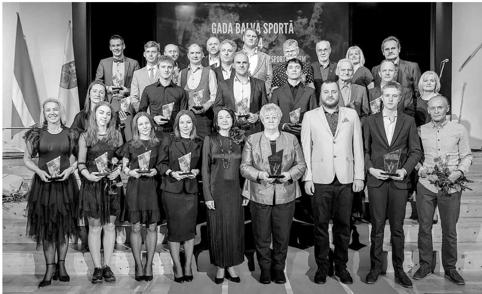
Smiltenes Kultūras centrā pulcējās Smiltenes novada sporta sabiedrība, lai jau 14. gadu pēc kārtas godinātu sportistus, trenerus un sporta personības svinīgajā ceremonijā Smiltenes novada „Gada balva sportā”.