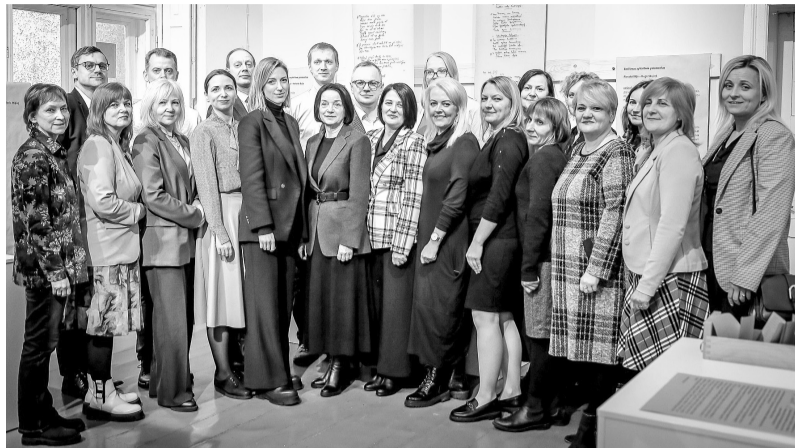
Smiltenes Novadpētniecības muzejā Mēru muižā kultūras ministre Agnese Lāce tikās ar Smiltenes novada pašvaldības vadību un kultūras jomas profesionāļiem.

Smiltenes novada kultūras attīstība balstās uz tādām vērtībām, kā satikšanās, sadarbība un izaugsme, kas sasauca ar pašu vizīti – satikšanās daudzveidīgajā un rosīgajā kultūrvīdē ne tikai kopīgos pasākumos, bet arī ikdienā. Tāpēc dienas pirmajā pusē Smiltenes Novadpētniecības muzejā