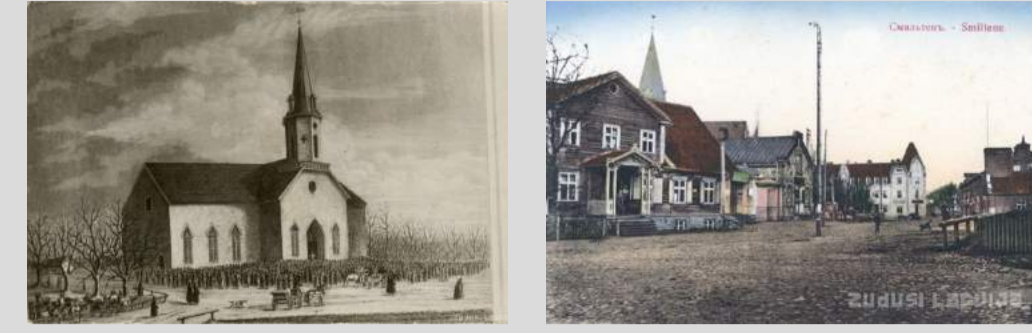
Smiltene baznīca 1859. gadā Baznīcas laukums 1914. gadā