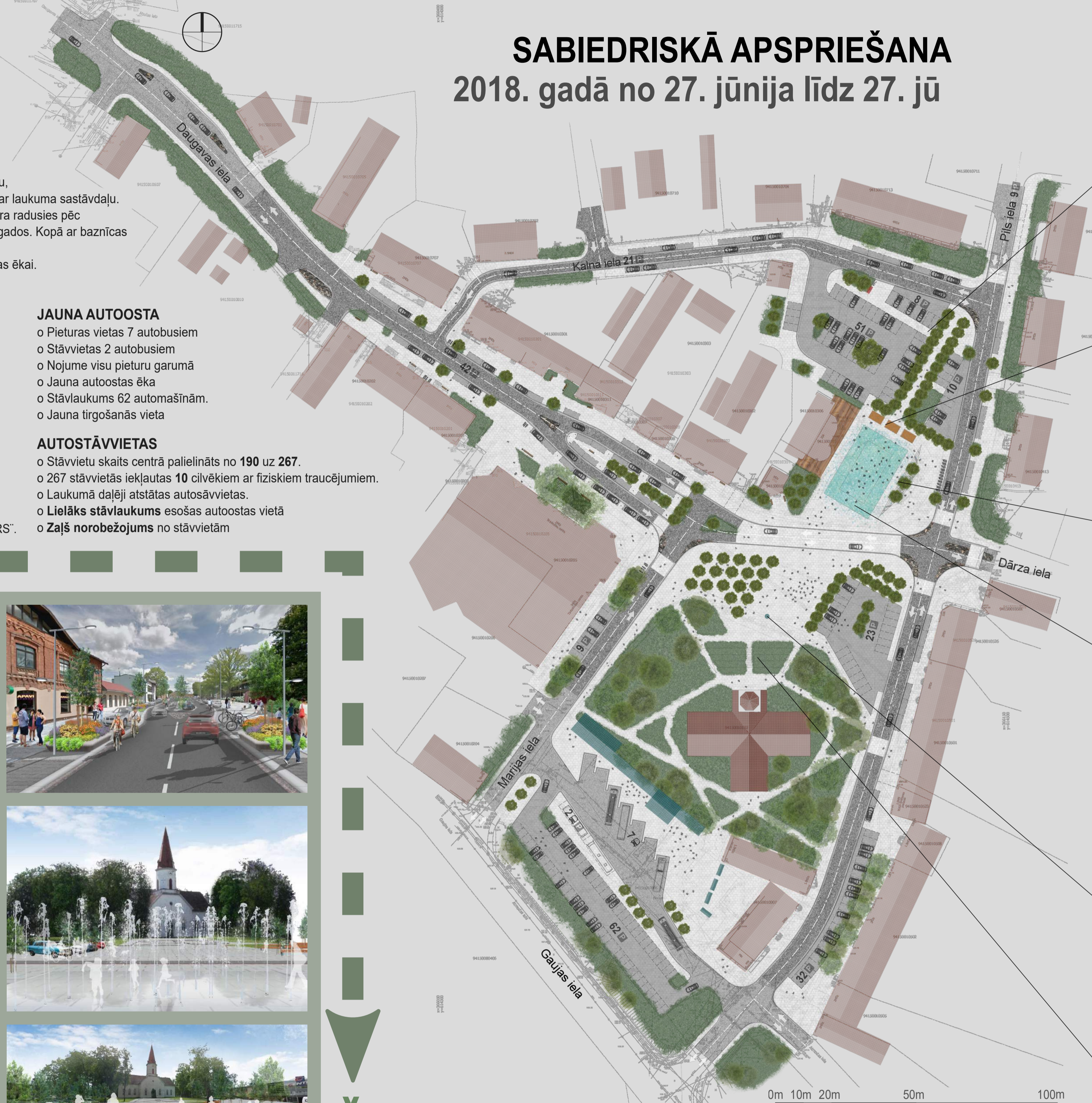
0m 10m 20m 50m 100m