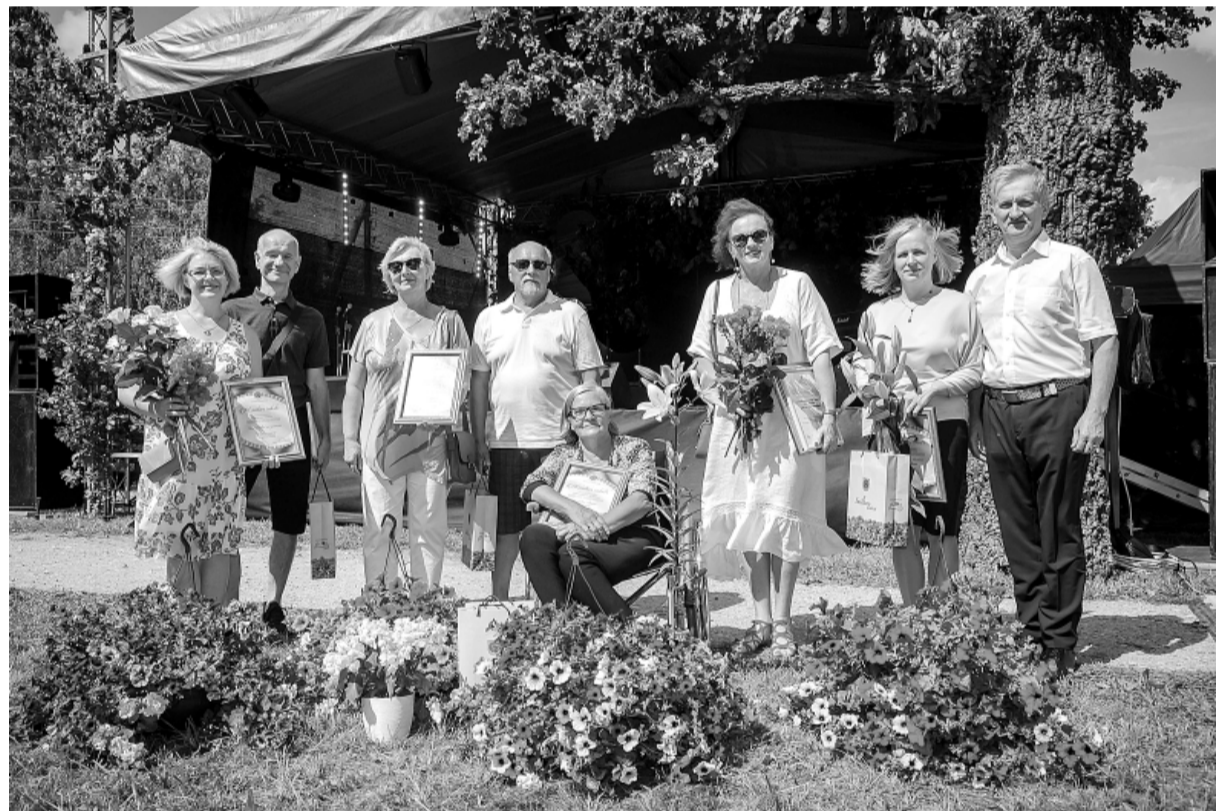
Konkursa laureāti: no kreisās „Kamaldiņa 13”, SIA „Smiltenes koks”, „Stūrīši”, „Saulgrieži”, „Lūžņas” īpašnieki.