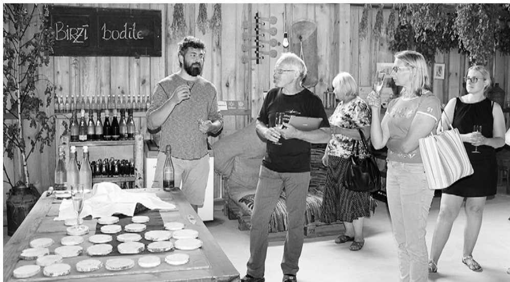
Bērzu sulu ražotnes „Birzi” apmeklējums.