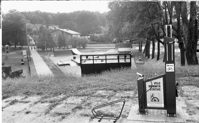
Velosipēdu remonta stātvīvs.

Pasākuma apmeklētājiem bija iespēja kopā ar sporta klubu „VeloLifestyle” izmēģināt braukšanu ar