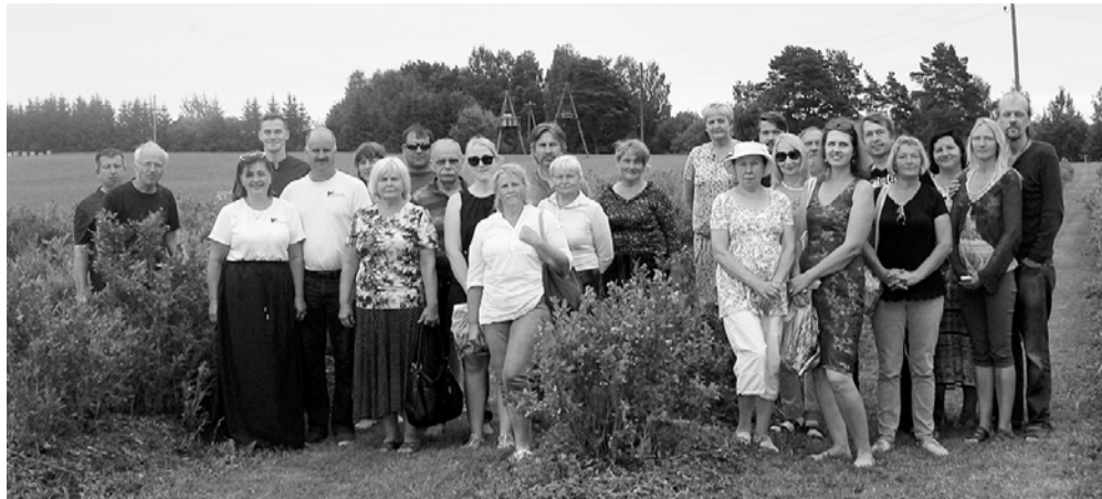
Krūmmellenju audzētāju - ZS „Zilāpi” apmeklējums.