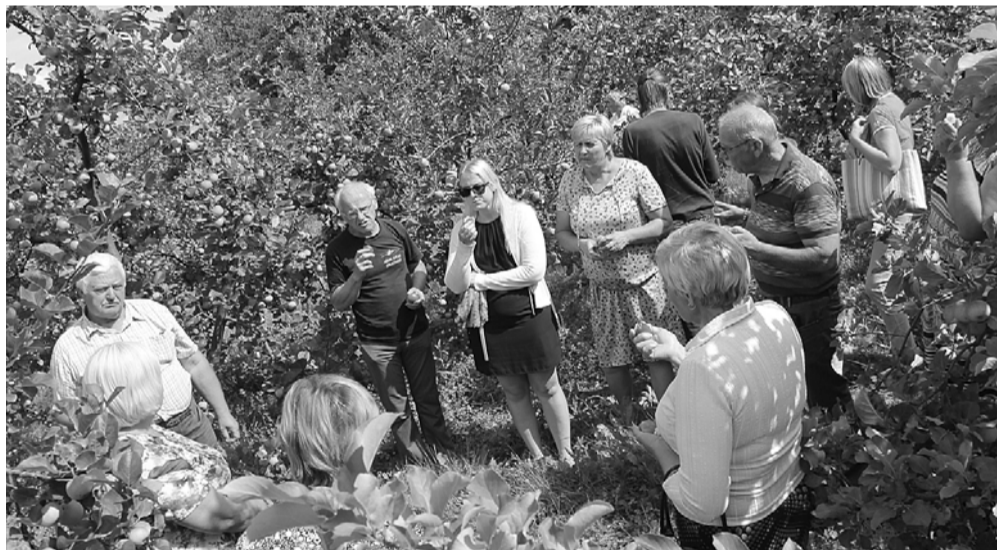
ZS „Veccepli” apmeklējums.

Igaunijas – Latvijas pārrobežu projekta „COOP Local” mērķis ir atdzīvīnāt un stiprināt pārrobežu uzņēmējdarbību, īstenojot virkni dažādu pasākumu, kas veicinās sadarbības un biznesa attiecību veidošanu starp Igaunijas un Latvijas uzņēmējiem. Projektā paredzētie pasākumi ietver gan pieredzes apmaiņas braucienus, gan kopīgas tikšanās, mācību ekskursijas un seminārus, gan kopīgas izstādes, gadatirgus, u.c.