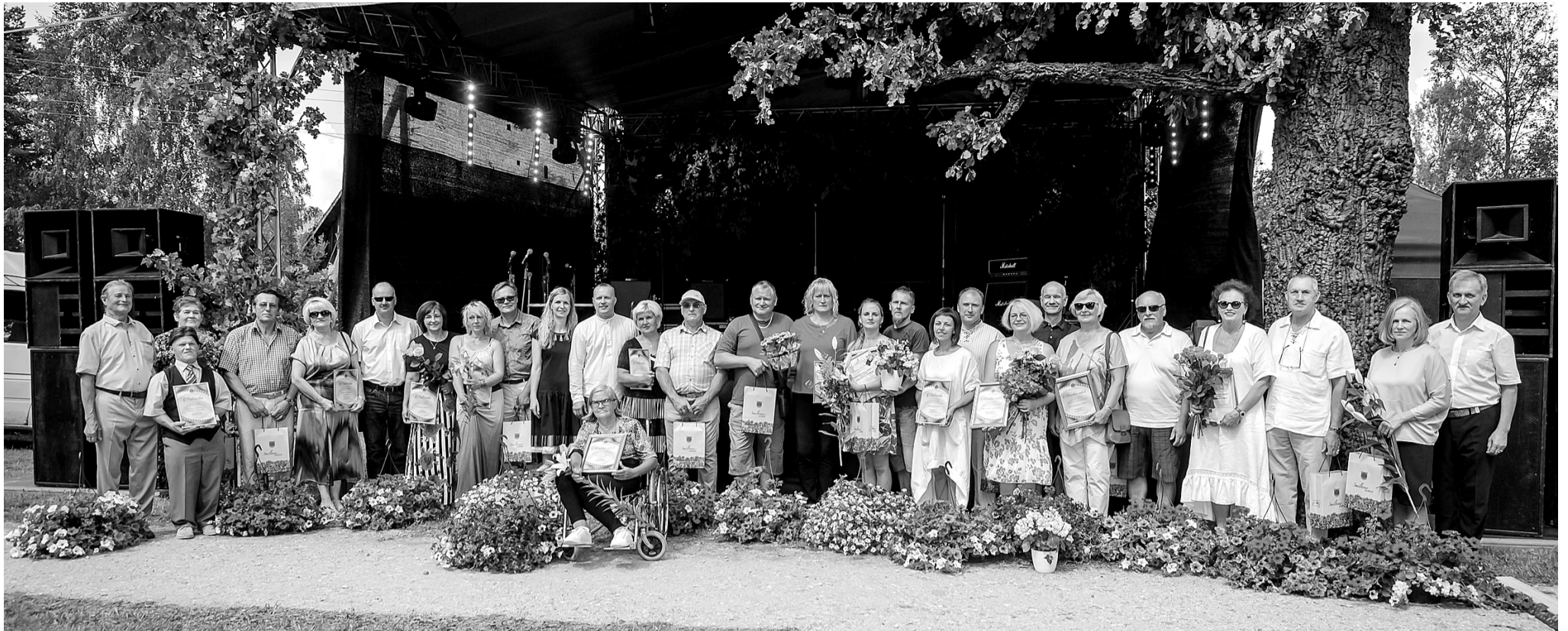
Visi konkursa laureāti un dalībnieki.

Smiltenes pilsētas svētku ietvaros apbalvoti Smiltenes novada sakoptāko viensētu, ģimenes mājas un uzņēmuma īpašnieki.