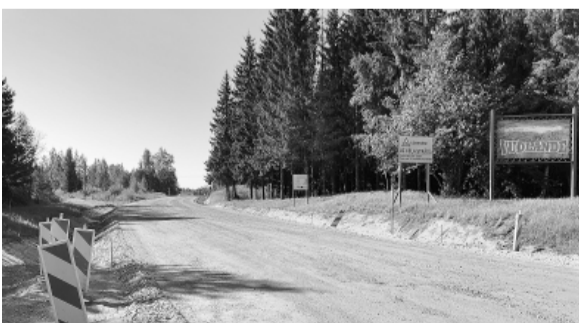
Autoceļa Smiltene – Rauziņa pārbūve.

teritorijās vietējiem uzņēmējiem pievilcīgu uzņēmējdarbības vidi, paaugstināt konkurētspēju, nodrošinot sociālo un ekonomisko aktivitāšu pieejamību Smiltenes novada uzņēmējiem un iedzīvotājiem. Plānots, ka projekta rezultātā atbalstītajā teritorijā tiks radītas