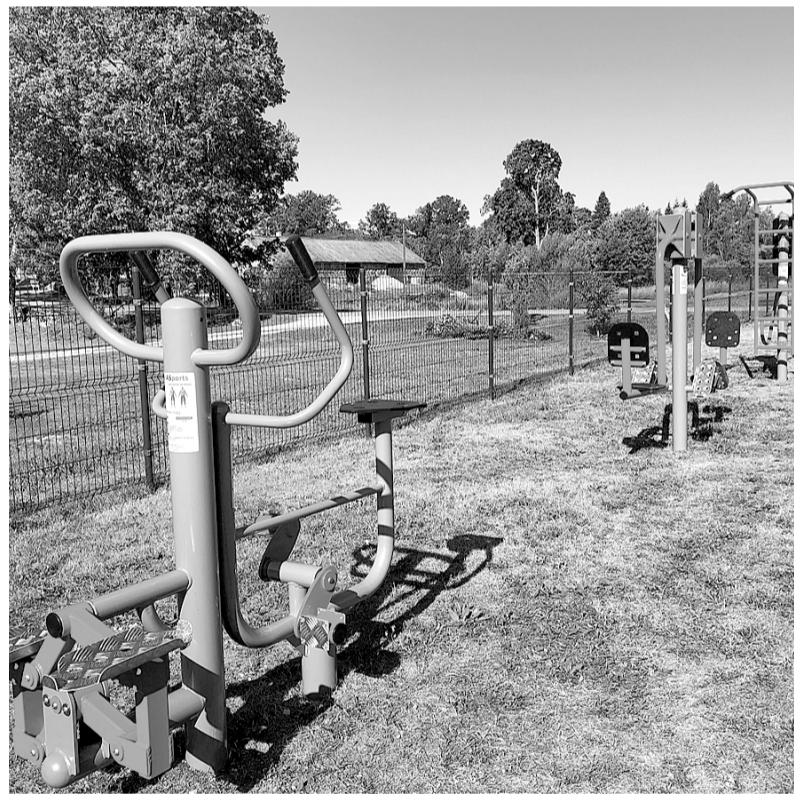
Aktīvās atpūtas laukums Launkalnē

lietotāji vienlaicīgi imitē iešanu, slēpošanu. Trenāžieris stiprina visa ķermeņa apakšējo daļu, rokas un plecu daļu.